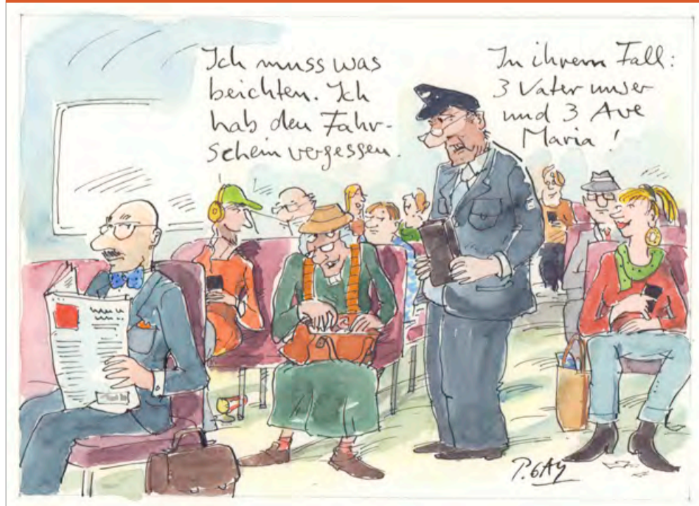
© Peter Gaymann, www.demensch.gaymann.de / Die Zeichnung stammt aus dem DEMENSCH-Kalender 2019.