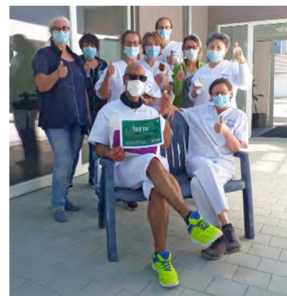
Unser Pflegeteam: trotz Ansteckungsrisiken besonnen und mutig

Wir setzen in unserer Sozialstation auf ein angenehmes Betriebsklima: Unsere Arbeitsplätze bieten neben allen Basics eine arbeitsmedizinische Betreuung, eine familienverträgliche Einsatzplanung sowie eine tarifliche Vergütung mit Zusatzversorgung, jährlicher Leistungszulage, Weihnachtsgeld und Lebensarbeitszeitmodell. Da die Einsätze in der häuslichen Pflege überwiegend in Teilzeit erbracht werden können, ist gerade die Arbeit in unserer Sozialstation ideal für junge Mütter und für Frauen, die nach der Familienphase wieder in ihren Pflegeberuf einsteigen wollen. Wir passen den Be-